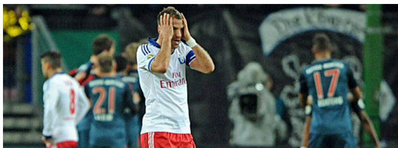
Er musste früh raus: Rafael van der Vaart.